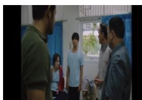
Gambar 6. Scene 6 (35:52-36:38)

Secara denotatif, adegan ini menampilkan ketegangan emosional antara ibu dan anak yang dipenuhi kemarahan, terlihat dari teguran ibu dengan nada tinggi dan intonasi keras yang mencerminkan kekecewaan mendalam hingga luapan emosi yang berpotensi berdampak pada kondisi psikologis anak. Pada tingkat konotatif, percakapan tersebut menunjukkan konflik batin seorang ibu antara kasih sayang dan amarah, di mana kata-kata yang diucapkan menyimpan rasa takut serta kekhawatiran terhadap penilaian sosial yang akan diterima keluarga. Sementara pada level mitos, adegan ini merefleksikan budaya masyarakat yang menjunjung tinggi kehormatan keluarga dan moralitas perempuan, sehingga kehamilan di luar nikah dipandang sebagai aib yang mencoreng citra keluarga.