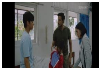
Gambar 4. Scene 4 (34:08-34:14)

Secara denotatif, adegan ini menampilkan dokter yang berbicara kepada Dara dan Bima dengan ekspresi serius namun lembut, menjelaskan bahwa mereka telah mempelajari reproduksi di sekolah, risiko kehamilan Dara tinggi karena tubuhnya belum siap, serta pentingnya dukungan moral, yang menunjukkan bahwa kehamilan remaja merupakan persoalan medis sekaligus emosional. Pada tingkat konotatif, percakapan tersebut menyampaikan pesan moral tentang pentingnya pendidikan seksualitas dan dukungan emosional, dengan dokter berfungsi sebagai simbol rasionalitas di tengah konflik keluarga. Sementara pada level mitos, adegan ini merefleksikan kondisi masyarakat yang masih menganggap isu reproduksi sebagai tabu, sehingga remaja kurang siap menghadapi konsekuensi biologis tindakannya; penekanan pada kebutuhan dukungan moral menegaskan bahwa empati seharusnya diutamakan dibanding penghakiman, serta bahwa pendidikan reproduksi perlu dibuka secara komunikatif, bukan ditutup oleh norma.