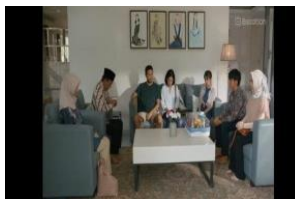
Gambar 2. Scene 2 (61:15)

Secara Denotatif, adegan ini memperlihatkan reaksi spontan dari Dara yang baru menyadari akan kehamilannya. Konotatif, ekspresi tersebut menandakan rasa takut, cemas, dan penyesalan yang tak terucap. Suara yang bergetar dan intonasi pelan menggambarkan adanya tekanan batin serta situasi berat yang dirasakan oleh Dara. Sedangkan Mitos, adegan ini mencerminkan pandangan budaya yang menempatkan perempuan sebagai moral keluarga. Dalam pandangan masyarakat yang masih menilai kehormatan perempuan berdasarkan kesucian dan perilakunya.