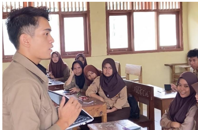
Gambar 1. Pemaparan materi komunikasi pemasaran digital dan brand awareness.

Tim Penelitian menyampaikan pemahaman terkait pentingnya komunikasi pemasaran digital dalam meningkatkan brand awareness SMA Muhammadiyah Kotabumi sebagai upaya dalam mempertahankan eksistensi sekolah. Hal ini berdasar persoalan yang terjadi pada SMA Muhammadiyah Kotabumi adalah penurunan jumlah siswa.