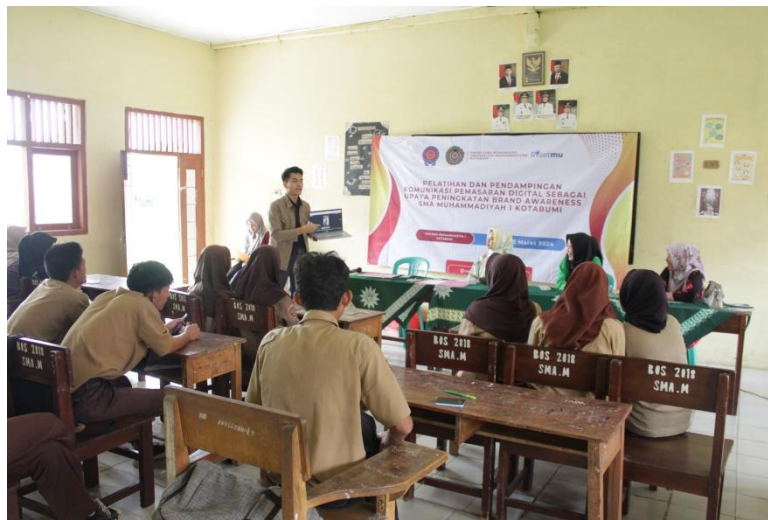
Gambar 3. Pelatihan dan pendampingan strategi pengelolaan pesan komunikasi pemasaran digital.

Tim penelitian memberikan pelatihan dan pendampingan secara langsung di lokasi aula SMA Muhammadiyah Kotabumi dengan dihadiri para stakeholder terkait serta siswa-siswi. Hal ini dilakukan untuk meningkatkan pemahaman dan keterampilan mitra dalam mengelola pesan dan menggunakan media digital. Topik yang dibahas mencakup segmentasi audiens, penentuan tujuan komunikasi, pembuatan konten yang efektif, dan penggunaan berbagai platform digital.