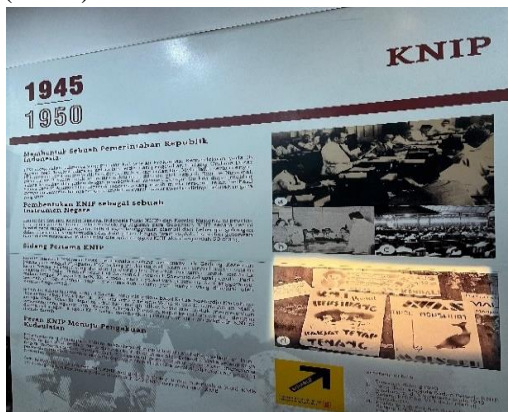
Gambar.8 KNIP 1945-1950

Pada masa itu, belum semua Lembaga Negara yang diatur dalam Undang-undang Dasar 1945 terbentuk. Oleh karena itu, posisi legislatif merujuk pada Pasal IV Peraturan Transisi UUD 1945, yang menyatakan bahwa MPR, DPR dan Dewan Pertimbangan Tertinggi di bawah Konstitusi tersebut di bentuk, segala kekuasaan diambil alih oleh Presiden. Dalam menjalankan tugasnya presiden membutuhkan bantuan dari pada Komite. Maka dari itu didirikanlah Komite Nasional