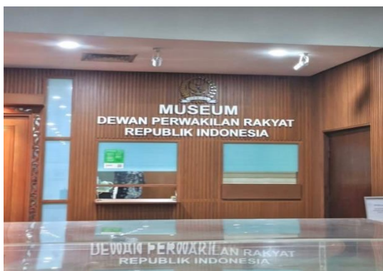
Gambar.1 Museum DPR RI

Dalam Gedung DPR RI terdapat Museum DPR RI. Museum ini merupakan bagian dari sejarah Dewan Perwakilan Rakyat Republik Indonesia sejak awal kemerdekaan hingga era reformasi. Museum ini memberikan peran pendidikan serta edukasi kepada masyarakat, khususnya generasi muda.(Sukirno & Haroni, 2022)