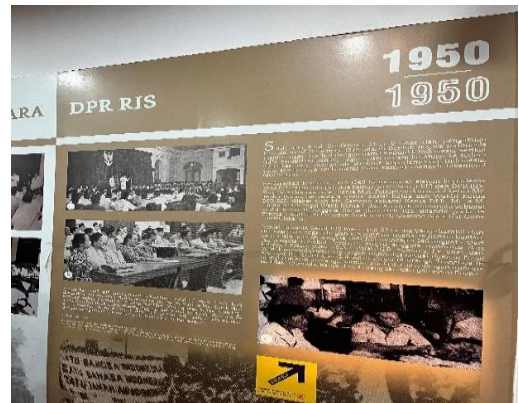
Gambar.9 DPR RIS

Sehubungan dengan diterimanya Hasil Konferensi Meja Bundar), hasil bentuk susunan Negara mengalami perubahan dari Republik menjadi Republik Indonesia Serikat (RIS). Hal ini sudah tercantum dalam Konstitusi RIS Pada pasal 1, yang menyatakan bahwa “kekuasaan dan kedaulatan Republik Indonesia Serikat dilakukan oleh Pemerintah bersamaan dengan Dewan Perwakilan Rakyat dan Senat.