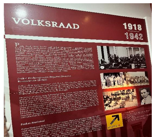
Gambar.7 Volksraad 1918-1942

Pada awal abad ke-20 saat geliat pergerakan organisasi-organisasi mulai tumbuh telah menimbulkan kesadaran akan golongan terdidik. Terdapat dua keinginan dari pihak penjajah dan terjajah dimana pihak pemerintah mencoba untuk mempermudah pengawasan dari gerakan-gerakan yang mengancam kondisi bumiputera pada saat itu, sedangkan pihak pergerakan menyadari betul perlunya suatu Badan perwakilan untuk menyuarakan usulan atau pendapat dari keinginan kaum Bumiputera demi kesejahteraan rakyat.