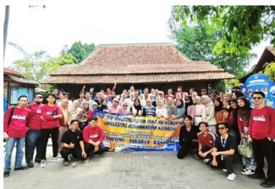
Gambar.4 Lembang Floating Market

The Great Asia Afrika adalah destinasi wisata menawan yang terletak di wilayah Lembang, Bandung Barat. Konsep wisata ini memadukan keindahan alam dengan pengalaman yang menakjubkan, para pengunjung dapat dengan leluasa menikmati diri dalam beragam keindahan Miniatur-miniatur Negara Asia dan Afrika.