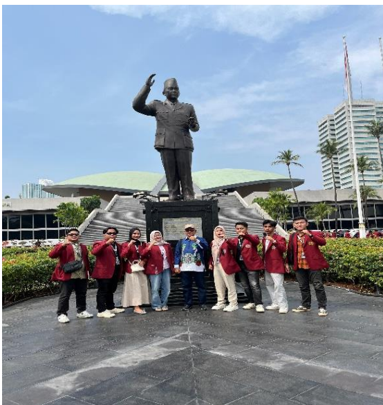
Gambar.6 Kelompok 3 Bersama Dpl