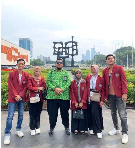
Gambar 1.6 Foto Bersama DPL di Halaman Gedung DPR RI

D'Castello adalah tempat wisata kuliner dan rekreasi keluarga yang terletak di Bandung, Jawa Barat. Lokasi nya berada di Jl. Surya Sumantri No. 55, Bandung, Jawa Barat. D'Castello memiliki konsep kastil Eropa dengan arsitektur megah dan indah. Harga Tiket Masuk: Rp 10.000-Rp 20.000 per orang. Harga Makanan dan minuman bervariasi.