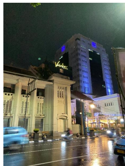
Gambar 1.2 Kota Bandung, Jawa Barat

Museum DPR RI terletak di Kompleks Parlemen, Jl. Jenderal Gatot Subroto, Senayan, Jakarta Pusat. Di dalam Museum DPR RI terdapat koleksi peninggalan Sejarah Indonesia seperti Ruang pameran sejarah perjuangan kemerdekaan Indonesia, Koleksi dokumen-dokumen sejarah, Foto-foto dan lukisan tokoh-tokoh perjuang kemerdekaan, Benda-benda antik seperti meja sidang pertama DPR, dan terdapat juga Perpustakaan dengan koleksi buku sejarah dan politik. Museum DPR RI merupakan tempat yang ideal untuk mempelajari sejarah dan perkembangan demokrasi di Indonesia.