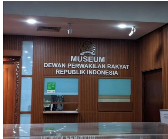
Gambar 1.1 Museum Dewan Perwakilan Rakyat Republik Indonesia (sumber : Mahasiswa Hukum)

Museum DPR RI terletak di Kompleks Parlemen, Jl. Jenderal Gatot Subroto, Senayan, Jakarta Pusat. Di dalam Museum DPR RI terdapat koleksi peninggalan Sejarah Indonesia seperti Ruang pameran sejarah perjuangan kemerdekaan Indonesia, Koleksi dokumen-dokumen sejarah, Foto-foto dan lukisan tokoh-tokoh perjuang kemerdekaan, Benda-benda antik seperti meja sidang pertama DPR, dan terdapat juga Perpustakaan dengan koleksi buku sejarah dan politik. Museum DPR RI merupakan tempat yang ideal untuk mempelajari sejarah dan perkembangan demokrasi di Indonesia.