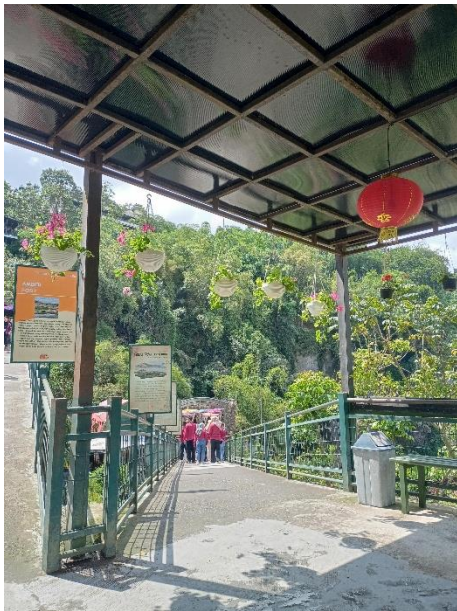
Gambar 1.3 Wisata The Great Asia Afrika

Selanjutnya Kota yang menjadi kunjungan Mahasiswa dan Mahasiswi Fakultas Hukum Dan Ilmu sosial Prodi Hukum Universitas Muhammadiyah Kotabumi adalah Kota Bandung. Karena Hotel tempat kami beristirahat berdekatan dengan Alun-Alun Kota Bandung yang dimana tempat tersebut banyak di jelajahi dan menjadi spot foto bagi Mahasiswa.