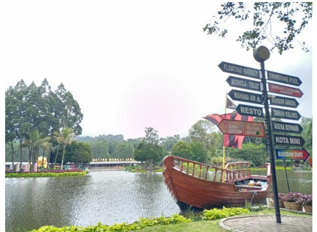
Bandung Jawa Barat