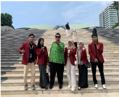
Gambar 1. Kunjungan ke gedung DPR RI, kelompok 12 bersama DPL.

salah satu tujuan utama dalam perjalanan field trip ini adalah mengunjungi gedung dewan perwakilan rakyat (DPR). Gedung DPR ini menjadi saksi bisu berbagai perubahan politik Indonesia. Selama kunjungan ini mahasiswa diberi penjelasan mengenai isi gedung DPR dan diajak berkeliling melihat isi gedung DPR.