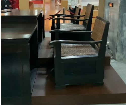
Gambar 3. Kursi sidang bersejarah yang di pajang museum DPR RI

sini tidak hanya berfungsi sebagai benda sejarah, tetapi juga menjadi saksi bisu bagi berbagai peristiwa politik pning dalam sejarah indonesia.