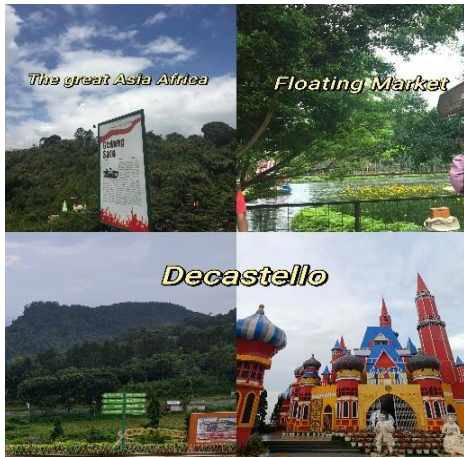
Gambar 5. Pemandangan wisata alam: the great asia africa, floating market & d’castello