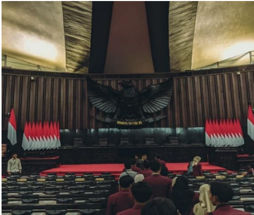
Gambar 4. Ruang Rapat Paripurna DPR RI