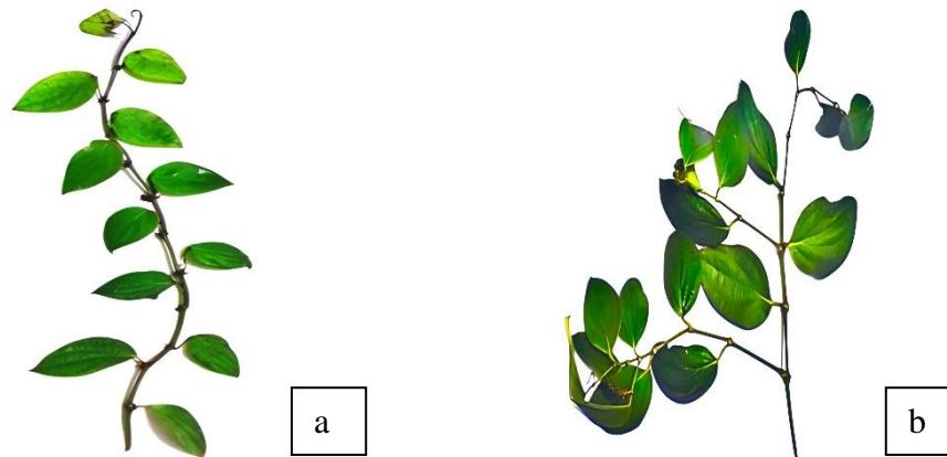
Gambar 1. Perbanyakkan stek berdasarkan asal bahan tanam lada varietas Natar 1. Keterangan: a) sulur panjang dan b) sulur buah.

sulur buah yang sehat dan tidak menunjukkan adanya tanda terserang penyakit, kemudian dipangkas hingga menyisakan dua ruas atau dua buku. Rancangan perlakuan yang digunakan yaitu rancangan perlakuan tunggal atau Single-case experimental designs (SCED) dengan tiga kali ulangan, sedangkan rancangan percobaan yang digunakan yaitu rancangan acak lengkap (RAL).